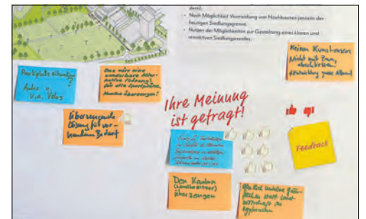
Inputs zur Zukunft der Gemeinde