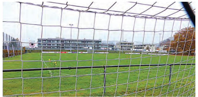
Welches ist der geeignete neue Standort für die Sportanlagen?

Bahnhof, Dreiecksplatz, Tell und Ecke Rütli/Coop. Überdies befasst sich die Ausstellung mit der Identität von Ostermundigen und stellt die Frage: Soll in einem Teil der Gemeinde der städtische und in einem anderen der dörfliche Charakter gestärkt werden? Nicht zur Diskussion steht hingegen eine allfällige Fusion mit Nachbargemeinden. Die Rückmeldungen aus der Bevölkerung fliessen übrigens in die weiteren Arbeiten der Ortsplanungsrevision ein. Die nächste öffentliche O'mundo-Veranstaltung ist im Frühjahr 2019 geplant. eps.